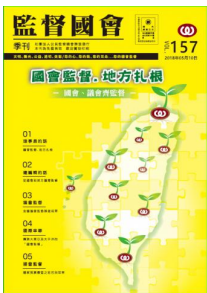
《監督國會》季刊第157期 全國唯一國會監督專刊 來電免費索取 02-2367-1571