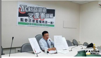
【今日新聞】監委調查軍公教年改 綠委批毀憲亂政 ( 詳見全文 )