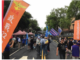
【聯合新聞網】軍改明起協商四天 拚下周三讀 ( 詳見全文 )