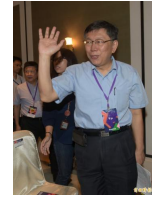
【自由時報】與黃國昌組雙北連線？柯文哲：網路時代應直接訴諸人民 ( 詳見全文 )