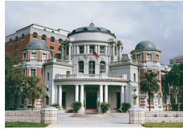
【中央社】彈劾案記名投票兩版本 12日院會最終定案 ( 詳見全文 )