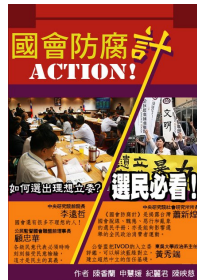
《國會防腐計ACTION!》 讓台灣國會脫線、醜態、惡行和亂象，不再重蹈覆轍，義賣價300元