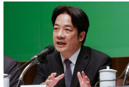
【民報】行政院會通過基層警消加薪方案 逾6萬人受惠 (詳見全文)