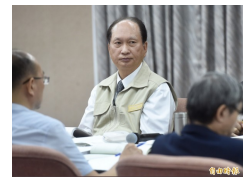
【自由時報】台灣省政府歸零！省主席：明年不再編預算 (詳見全文)