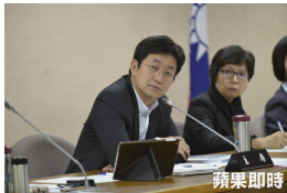
【蘋果日報】難譜！10年未參與CAPAM年會 銓敘部竟年年都編預算 (詳見全文)