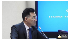
【今日新聞】布國斷交前 蔡英文直播賣荔枝惹議 (詳見全文)