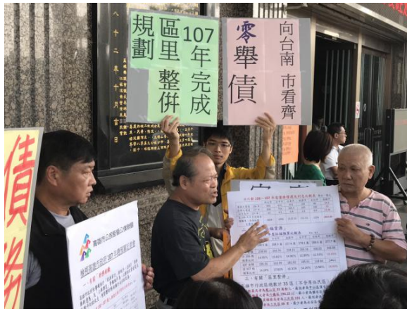
106年 11月7日在高雄市議會門口召開記者會，要求陳菊市長承諾「零舉債」

註：參閱《全球國會監督組織大調查》（國會公督盟摘要翻譯，原文： A Global Survey of Parliamentary Monitoring Organizations ，美國民主基金會（NDI）和世界銀行研究所（WBI）出版。）